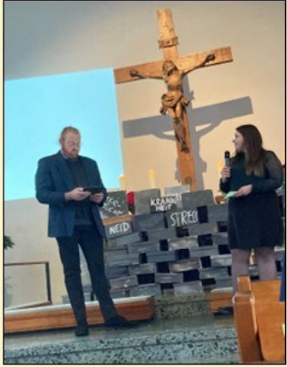
Weihnachtsliedersingen am 23.01.2023