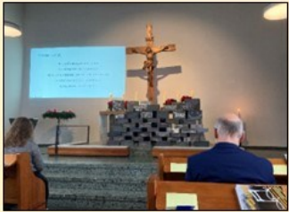
oben: Jugendgottesdienst am 3. Advent (md)